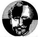
Fundación Centro de Estudios Vicente Blasco Ibáñez